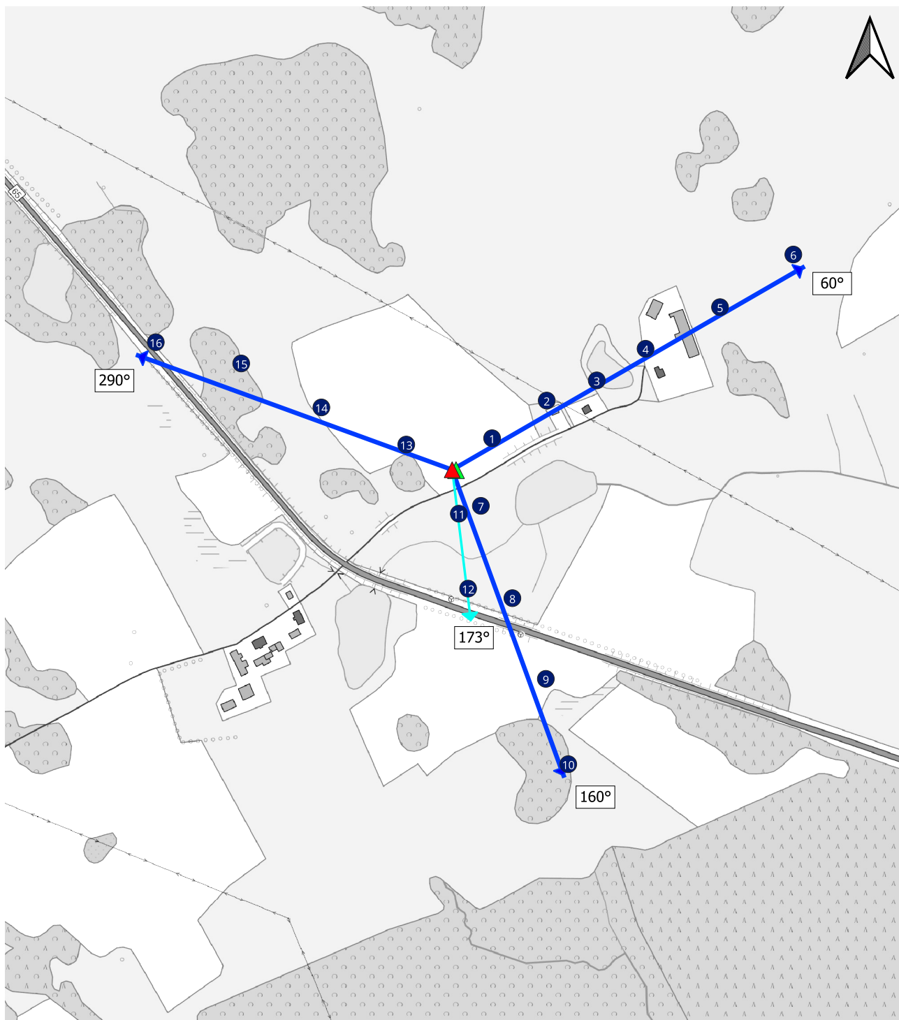
Załącznik 2. Widok pionów pomiarowych