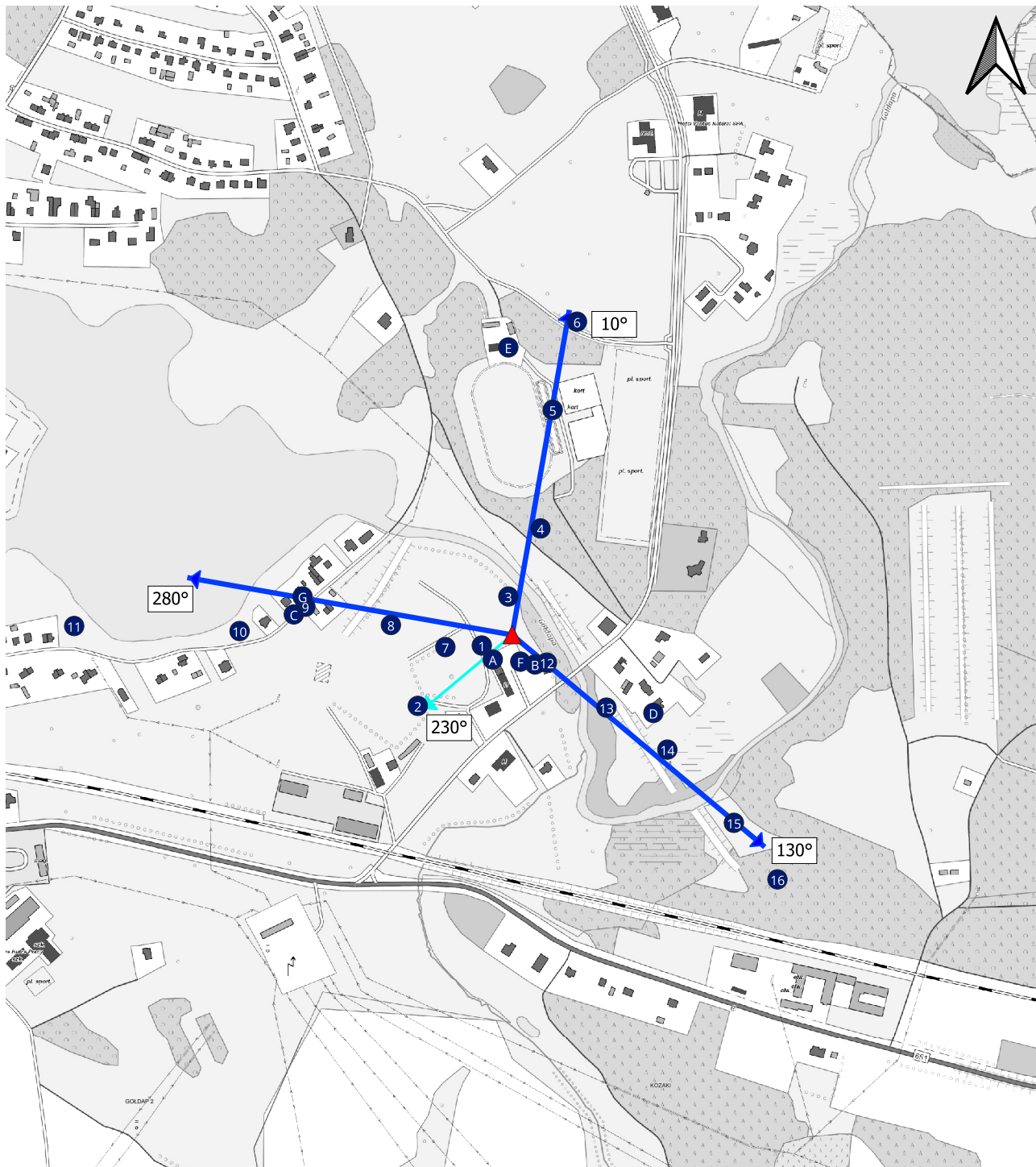
Zał. 2. Widok pionów pomiarowych