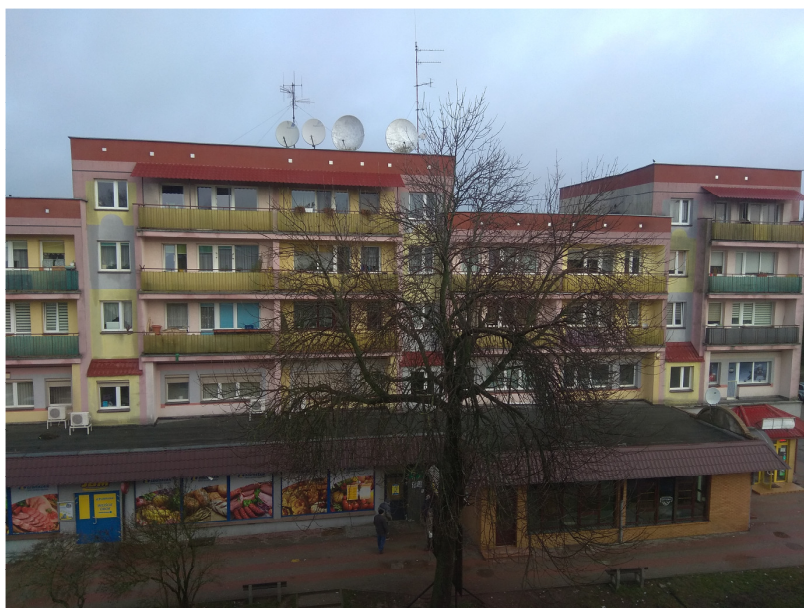
Widok obiektu wraz z zainstalowanym zespołem antenowym