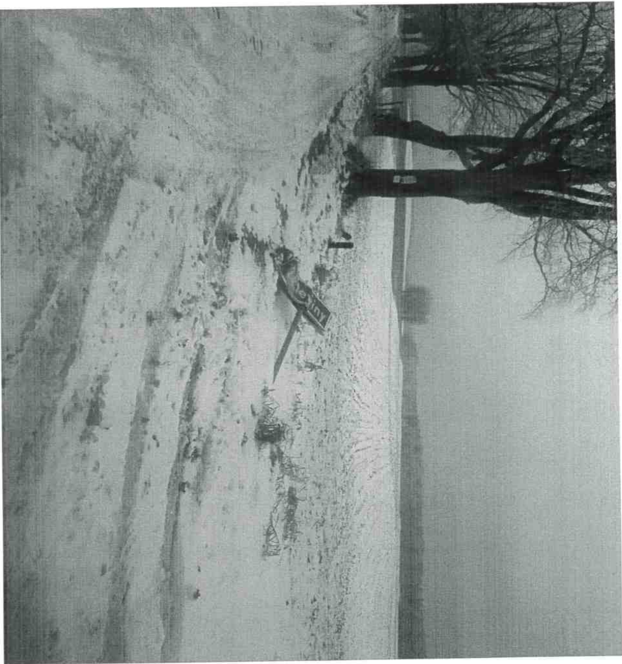
str. 3 z 3