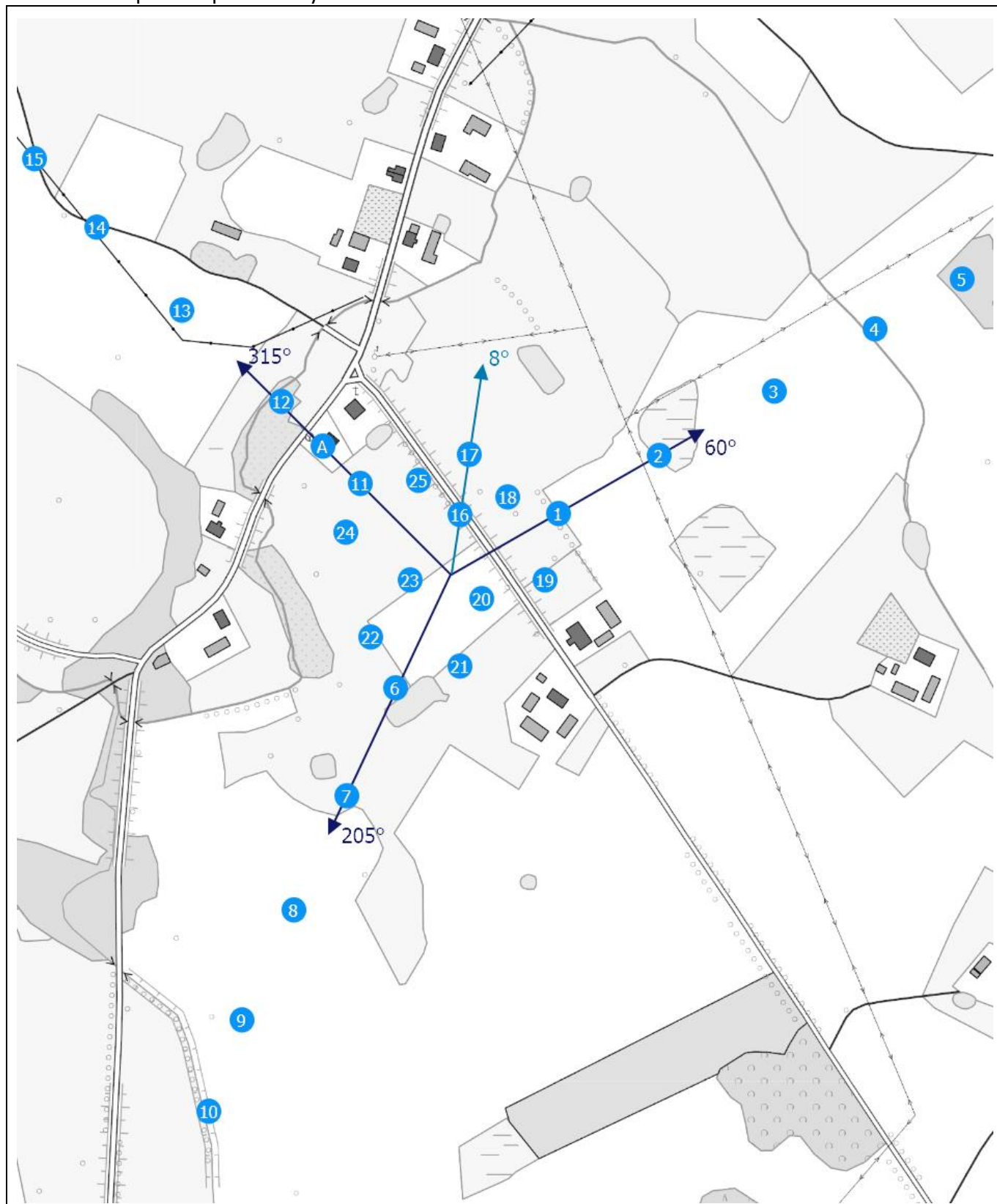
Zał. 2. Widok pionów pomiarowych