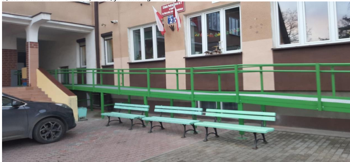
Szkoła Podstawowa nr 2 im. Marszałka Józefa Piłsudskiego w Gołdapi

Realizacje w ramach złożonych wniosków przez powiat do Państwowego Funduszu Rehabilitacji Osób Niepełnosprawnych (zdjęcia):