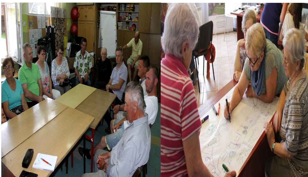
Fotorelacja „Centrum Wspierania Aktywności Społecznej”

i) Stowarzyszenie Gołdapski Fundusz Lokalny - zadanie pod nazwą „Centrum Wspierania Aktywności Społecznej” - wysokość wsparcia 5 000,00 zł,