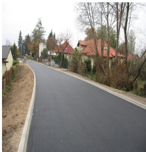
Po zakończeniu budowy