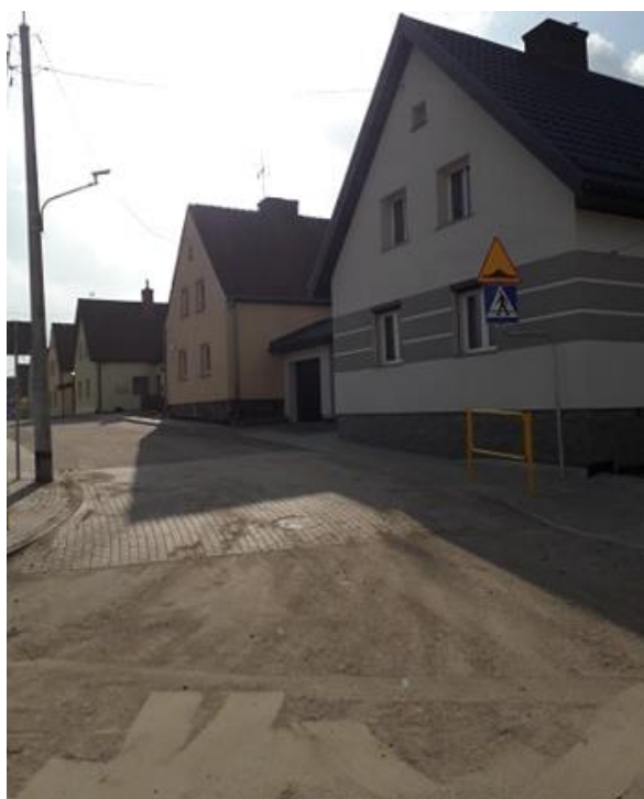
ul. Zielona po przebudowie