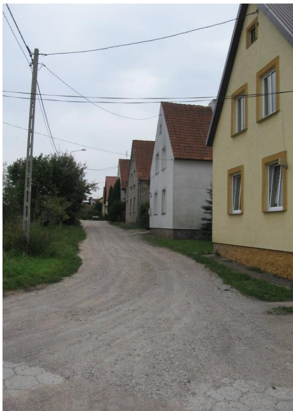
ul. Mała przed przebudową