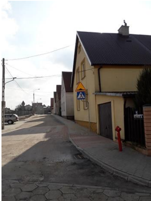
ul. Mała po przebudowie