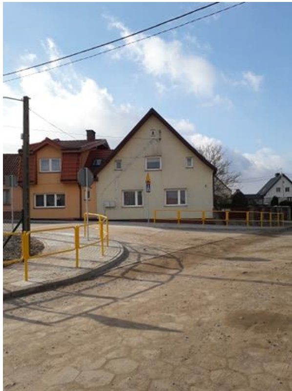
ul. Cicha po przebudowie