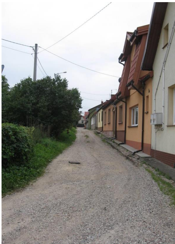
ul. Cicha przed przebudową