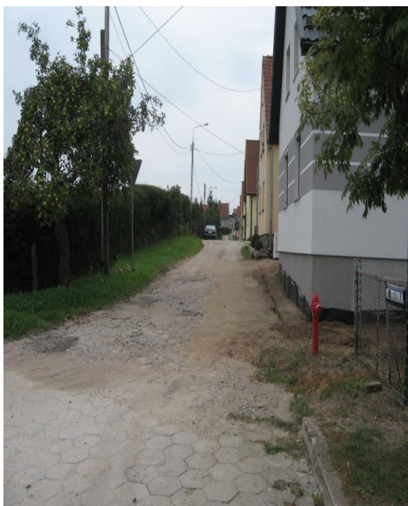
ul. Zielona przed przebudową