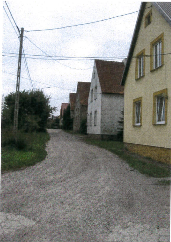
ul. Mała przed przebudową