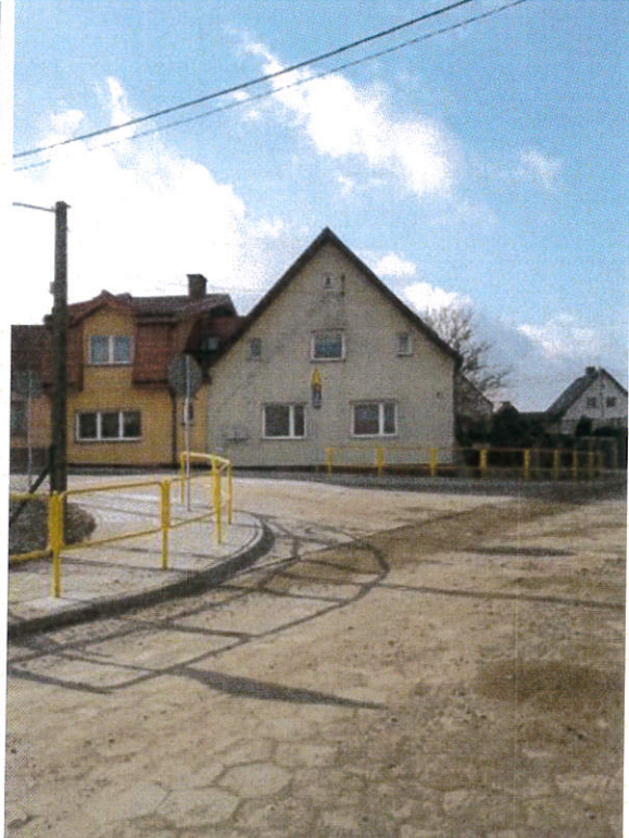
ul. Cicha po przebudowie