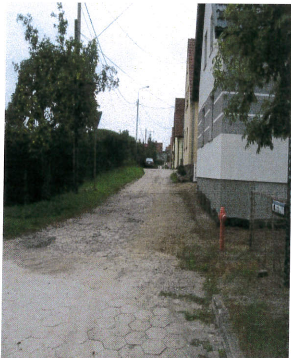
ul. Zielona przed przebudową