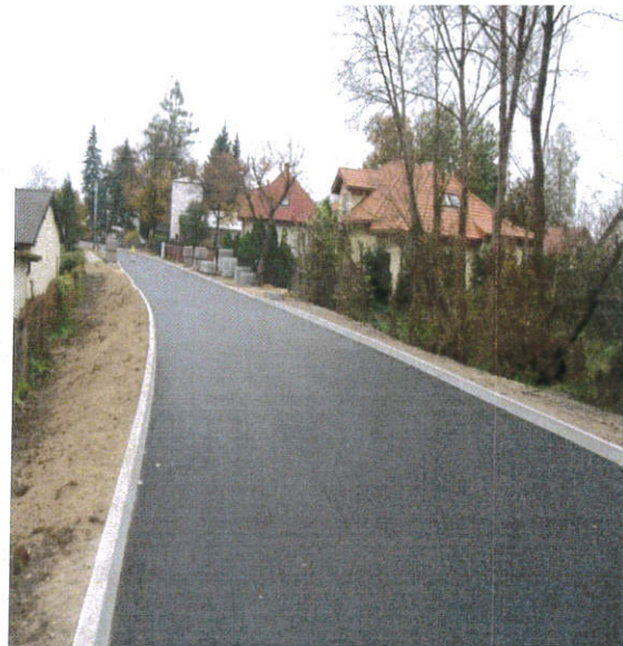
Po zakończeniu budowy