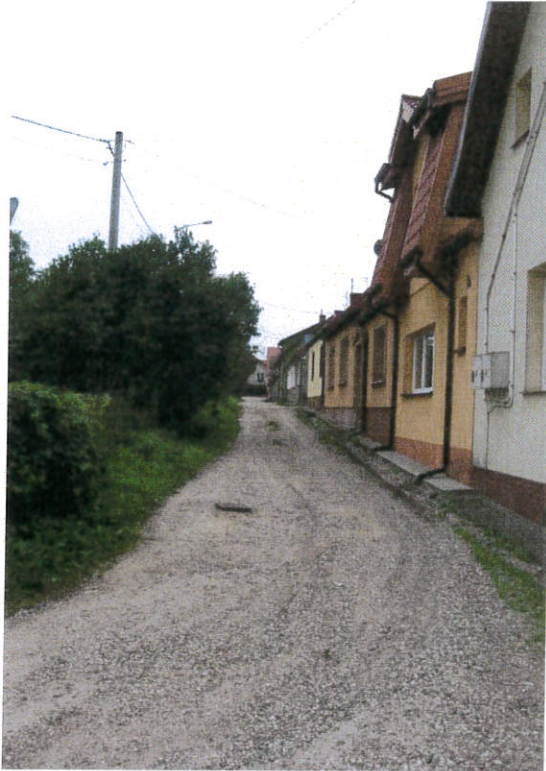
ul. Cicha przed przebudową