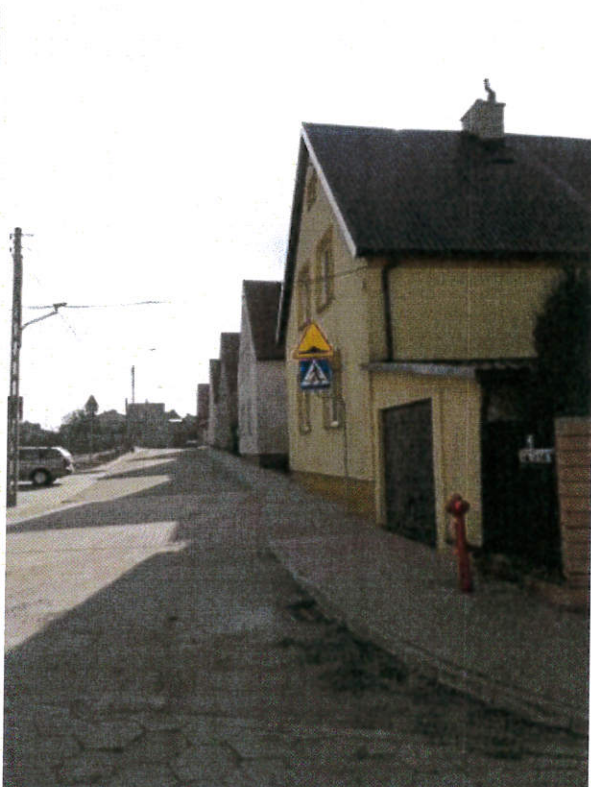
ul. Mała po przebudowie