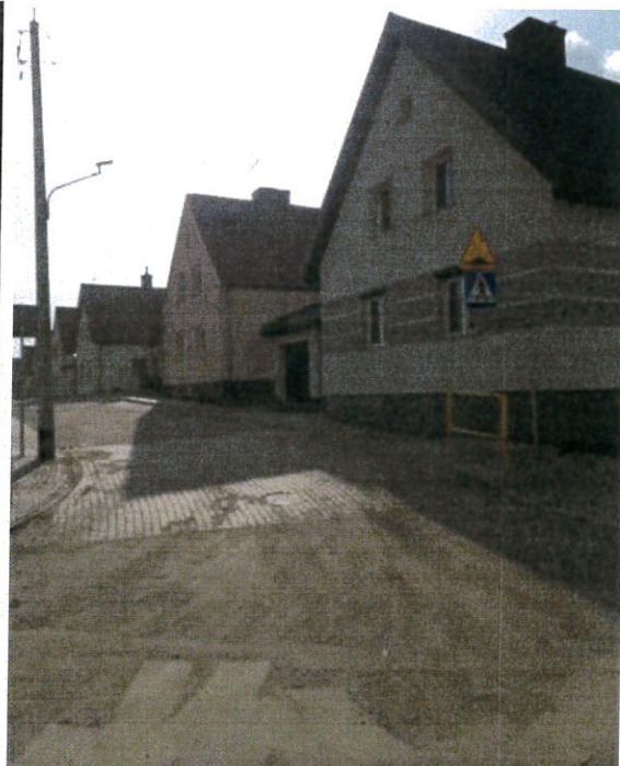
ul. Zielona po przebudowie